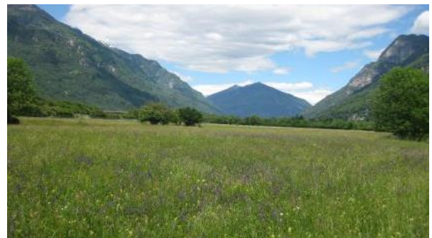
Prati gestiti in modo estensivo sul fondovalle della Riviera