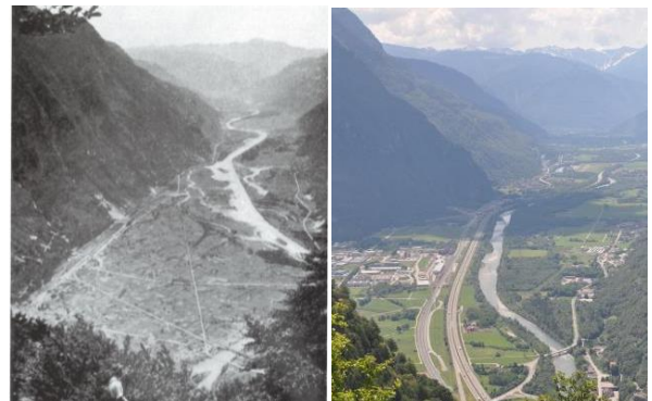
Vista della Valle Riviera dai monti di Pollegio (1920 e 2015)