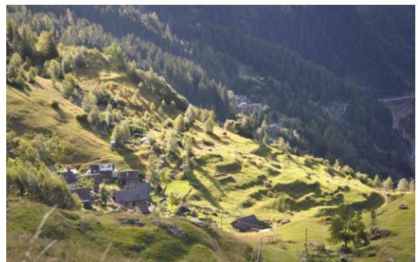
Prati terrazzati della Val Pontirone