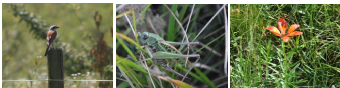
Averla piccola, Locustone e Giglio rosso: specie "faro" del progetto