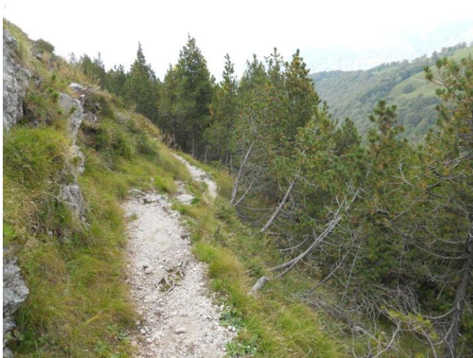
Bosco di pino mugho