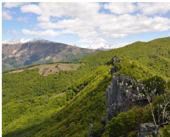
Scorcio sulla riserva