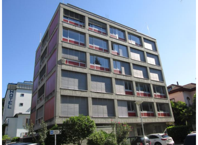
Stabile prima del risanamento