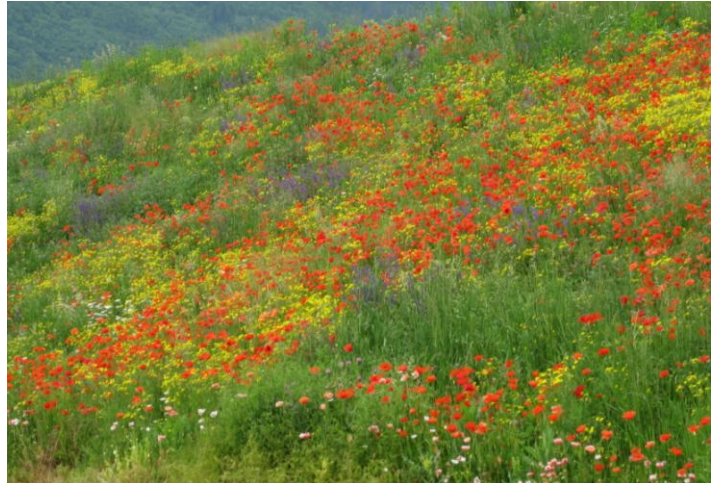
Discarica RSU Pizzante 2: sistemazione finale con prati xerici fioriti