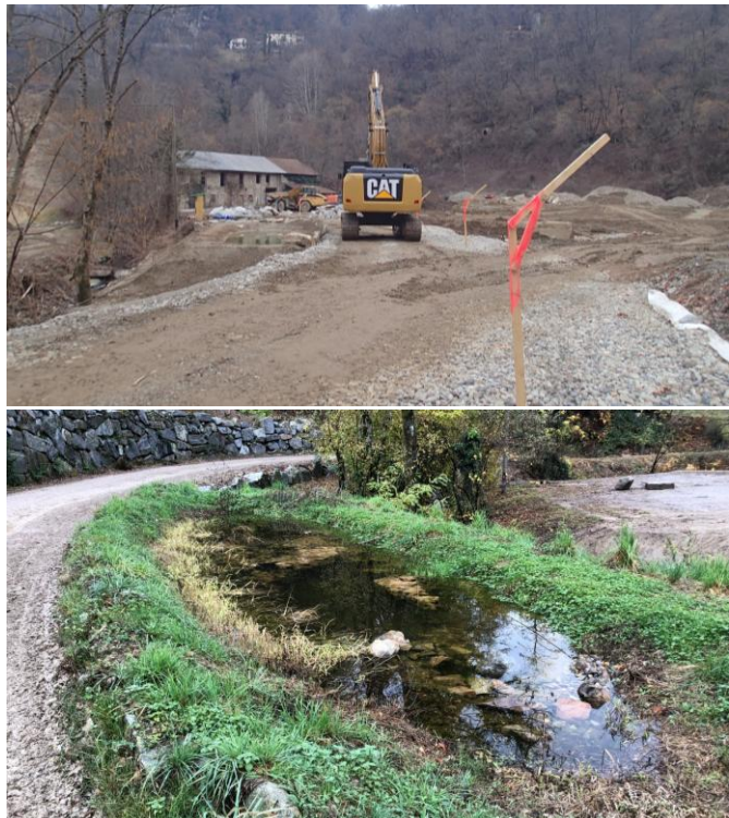
Costruzione della discarica regionale a Monteggio: formazione di uno stagno naturalistico nei pressi del riale Pevereggia