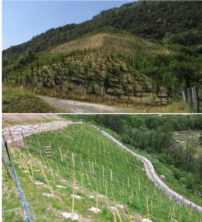
Rimboschimenti alla discarica regionale Spineda