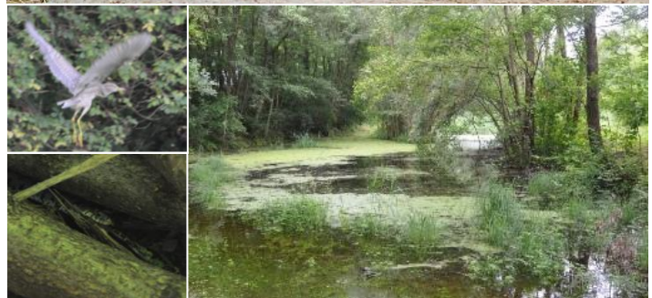
Discarica RSU Pizzante 2: stagno di falda (sopra: in fase di realizzazione, sotto: situazione attuale). Nei riquadri: nitticora e biscia dal collare intenta a predare una rana verde