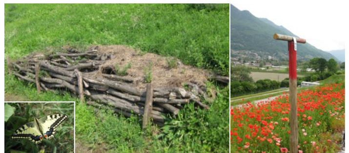
Discarica RSU Pizzante 2: strutture create sul corpo della discarica. Nel riquadro un macaone