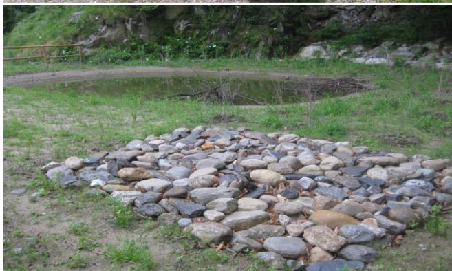
Sistemazione finale discarica regionale di Avegno-Gordevio: piantagioni e realizzazione di panchine e stagno con pietraia sul colmo