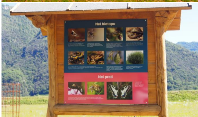
Sistemazione finale discarica regionale di Petasio, con la realizzazione alla sommità di un'area naturalistica didattica e di svago