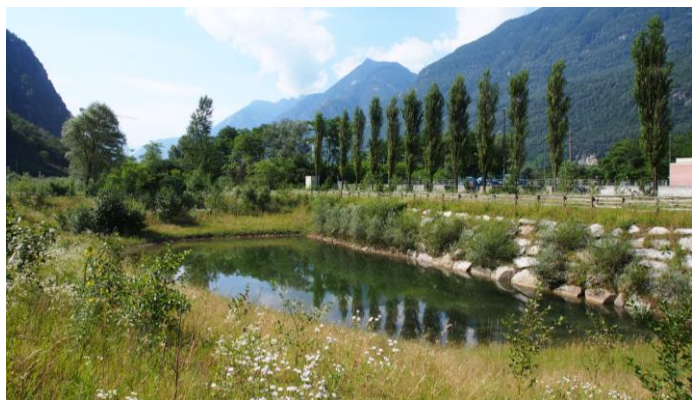
Nuovo stagno IDA - Biasca