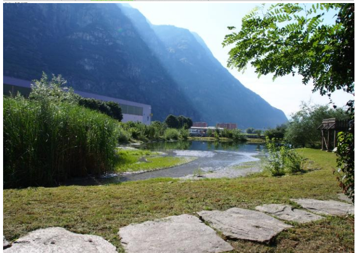
Nuovo biotopo Dragone a Biasca