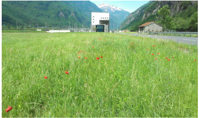
Sistemazione agricola delle aree di cantiere