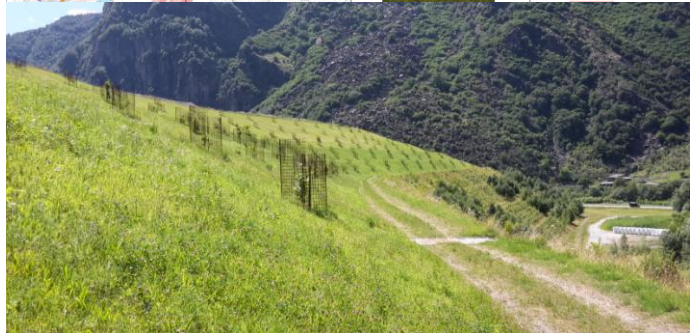
Deposito alla Buzza di Biasca – rinverdimenti e piantagioni