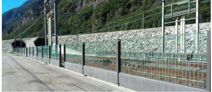
Portale sud della Galleria di base del San Gottardo

Nuova trasversale alpina nella tratta a cielo aperto tra il portale sud della Galleria di base del San Gottardo e il Nodo della Giustizia. Opere ferroviarie (rilevati, ponti, gallerie, ecc.), opere di genio civile (depositi definitivi di materiale, nuove strade di collegamento, ripari fonici, ecc.), opere ambientali e forestali (biotopi, rivitalizzazione corsi d'acqua, rimboschimenti compensativi, riqualifiche agricole, ecc.).