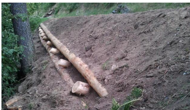
Zona 2: Situazione prima e dopo i lavori