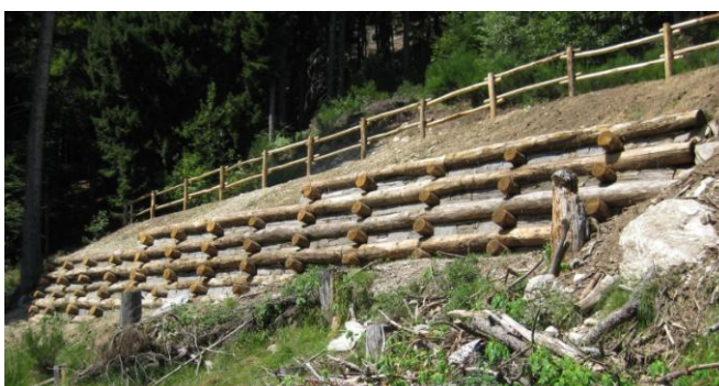
Zona 1: Situazione prima e dopo i lavori