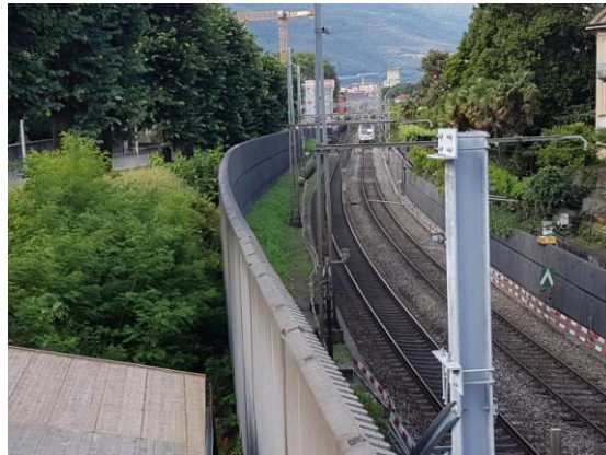
Ripari fonici FFS a Bellinzona