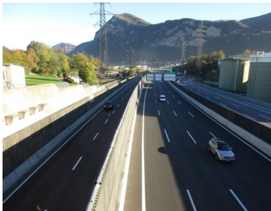
Ripari fonici svincoli N2 a Mendrisio