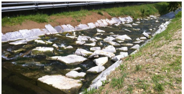
Nuova rampa Cercera sul Lavaggio