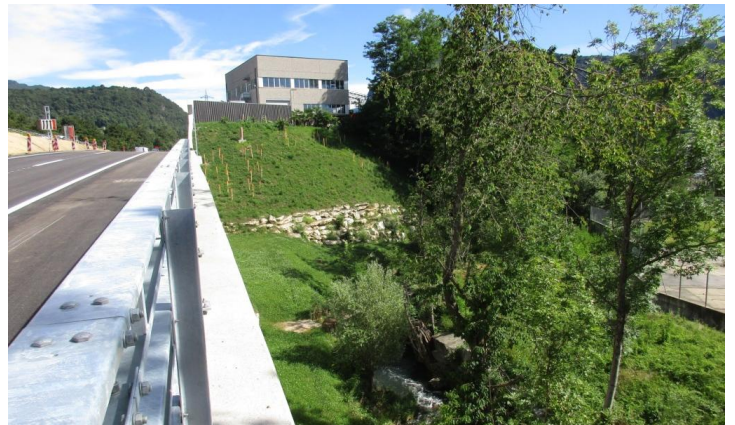
Piantumazioni presso il viadotto Tana