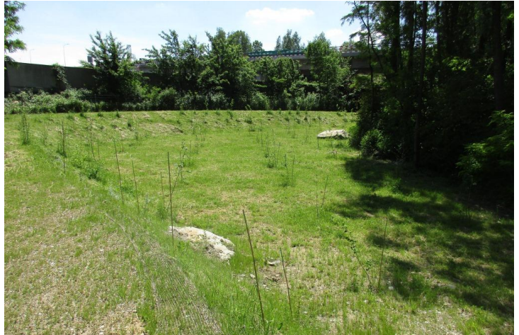
Piantumazioni presso il biotopo umido