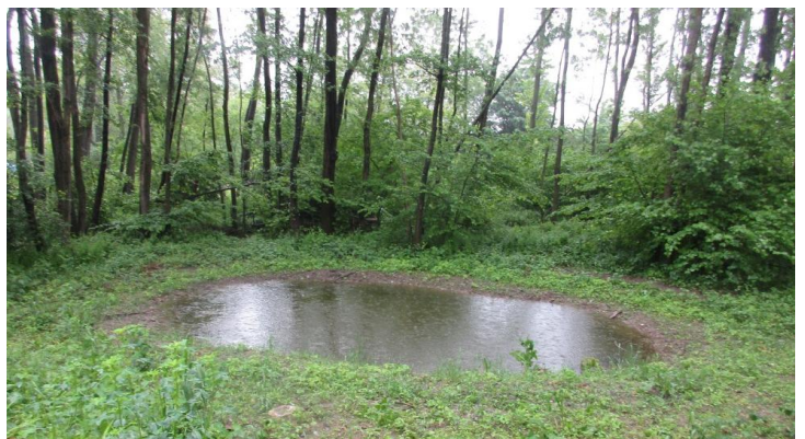
Creazione di un biotopo umido a Rancate